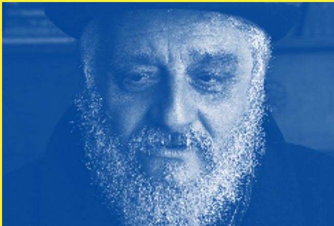
Boris Khersonsky : invité d'honneur du festival