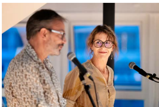
La comédienne Florence Viala