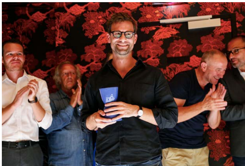
Nicolas Mathieu, lauréat du prix en 2018 et le jury

Le prix Blù Jean-Marc Roberts, créé en 2017, se veut à son image : un pari sur une œuvre en devenir , une récompense audacieuse faisant entendre une voix différente au cœur de la rentrée littéraire . Le prix souhaite « cueillir » un auteur à son moment d'écllosion, le mettre en lumière. Sa vocation est d'accompagner un auteur et de faire découvrir son œuvre à un public nombreux. Des rencontres dans diverses librairies seront organisées en France et à l'étranger.