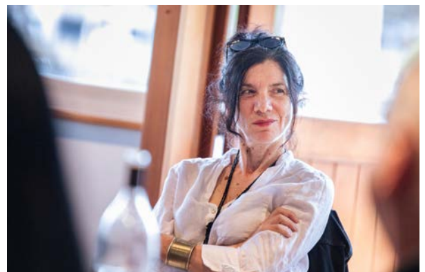
Brigitte Giraud, Jurée, prix Goncourt