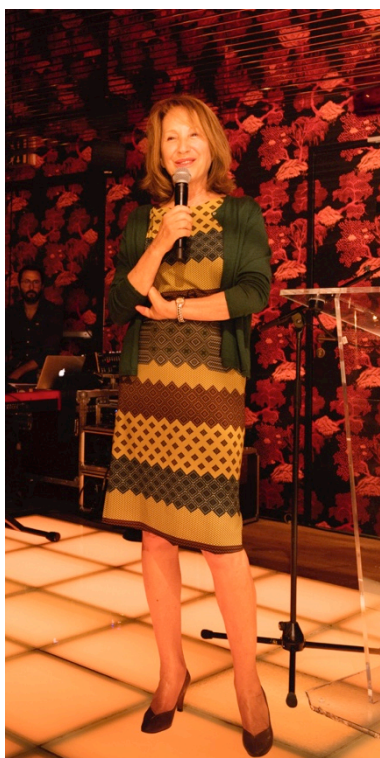
Nathalie Baye, marraine du prix

La soirée se veut aussi à l'image d'un homme féru de variétés françaises et italiennes, de football, de poker, de whisky et de vins. Littérature et convivialité sont à l'honneur depuis 2017 grâce aux mécènes du prix : Vignobles & Signatures, Hachette Livre, Audiens. En 2021 et 2022, le prix a reçu le prestigieux soutien de la Fondation Jan Michalski.