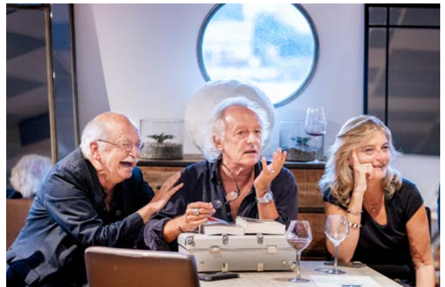
Erik Orsenna, Didier Barbelivien et Sandrine Treiner

Le prix Blù Jean-Marc Roberts aidera le lauréat à décliner son livre en lecture musicale ou littéraire , via, par exemple, une résidence de création (format qui pourrait être repris dans des festivals littéraires) et à promouvoir son travail auprès d'un public varié : master class en milieu scolaire, rencontres en librairies (réseaux de librairies françaises ou francophones). Il s'agit d'associer littérature et musique à l'image de Jean-Marc Roberts, de transmettre le goût de la lecture aux jeunes générations et la passion d'écrire.